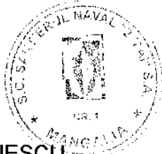
..... Ionut Cosmin CONSTANTINESCU